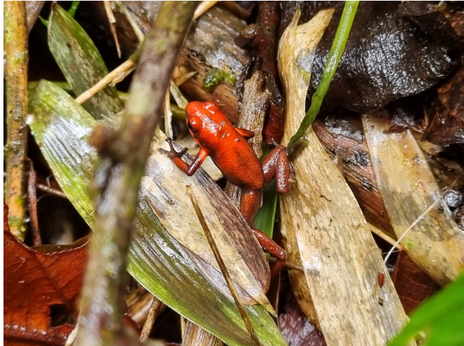
Figura 1: Individuo de Andinobates dorisswansonae en el Municipio de Casabianca (Tolima), (código de fotografía MNHN 6146). Figure 1: Individual of Andinobates dorisswansonae in the

costados del cuerpo (Rueda-Almonacid et al. 2006, Kahn et al. 2016). Algunos individuos pueden tener el vientre y las extremidades negras, marrón negruzco, o rojo moteado (Kahn et al. 2016). En la población de El Líbano (Tolima), los individuos presentan una coloración dorsal ocre dorada desde la cabeza hasta la zona media de la espalda, donde transcende a un marrón oscuro. Dicha coloración se observa del mismo modo en las extremidades y la región ventral (Alfaro 2010, Caicedo-Cárdenas y Ospina-Céspedes 2020).