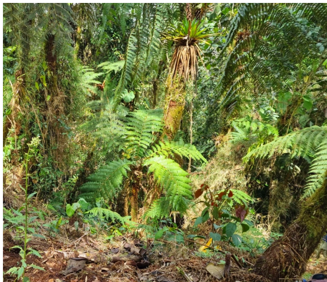
Figura 3: Hábitat de Andinobates dorisswansonae en la vereda Peñolcitos, Municipio de Casabianca, Departamento de Tolima, Colombia. Figure 3: Habitat of Andinobates dorisswansonae in the village of Peñolcitos, Municipality of Casabianca, Department of Tolima, Colombia.

km 2 (2) Número de localidades \leq 5 (3) fluctuación en la extensión de presencia. (1) (AOO) < 500 km 2 (2) Número de localidades \leq 5 (3) fluctuación en el área de ocupación.