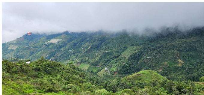
Figura 4: Fotografía panorámica del paisaje en la vereda Peñolcitos, Municipio de Casabianca, Departamento de Tolima, Colombia. La estrella roja indica el bosque donde se registró el individuo de Andinobates dorisswansonae . Figure 4: Panoramic photograph of the landscape in the village of Peñolcitos, Municipality of Casabianca, Department of Tolima, Colombia. The red star indicates the forest where the Andinobates dorisswansonae individual was recorded.

Posteriormente, se registraron tres individuos en la misma localidad. Sin embargo, se desconoce el estado de esta población, que podrían estar presentando disminución en esa área. El área de los registros corresponde a un pequeño parche de bosque denso alto, que se caracteriza por la presencia de helechos arbóreos Cyathea caracasana , plantas epifitas Guzmania sp., gramíneas Chusquea sp. y especies arbóreas principalmente Dendrobangia boliviana y Elaeagia utilis (Fig. 3). El bosque tiene poca conectividad con otros parches de bosque, y mayor cercanía a coberturas de pastos arbolados y de pastos limpios utilizados para la ganadería y cultivos agrícolas (Fig. 4). Es importante resaltar que en el lugar de registro se evidencia una ampliación de la frontera agrícola, lo cual puede amenazar la población de este anfibio. Es importante realizar estudios